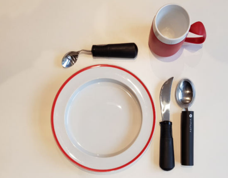
Ergonomisches Geschirr und Besteck