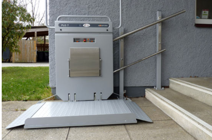
Plattform-Lift, Quelle: Stadt Schwabach / Musterwohnung Tabea-Landkreis Roth