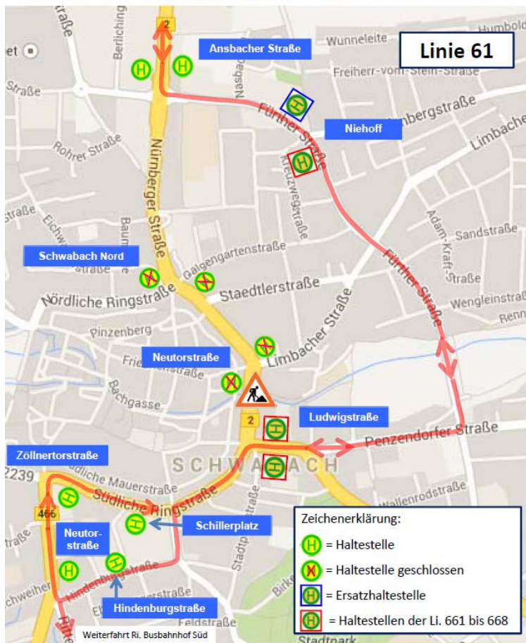
Li. 61 und N61 – Umleitung wegen Sperrung der Landknechtsbrücke

Zwischen den Haltestellen Ansbacher Straße und Hindenburgstraße fährt die Linie 61 eine Umleitung über die Fürther Straße, die Penzendorfer Straße und die Südliche Ringstraße. Die Haltestellen Schwabach Nord und Neutorstraße werden nicht bedient. Als Ersatz wird die auf der Umleitungsstrecke liegende Haltestelle Niehoff (Li. 662), in der Fürther Straße, Höhe Kreuzwegstraße mit angebunden. Gegenüber, in der Fürther Straße 30, wird eine Ersatzhaltestelle eingerichtet. Ebenfalls mit bedient wird in der Ludwigstraße die gleichnamige Haltestelle (Li. 661 bis 668).