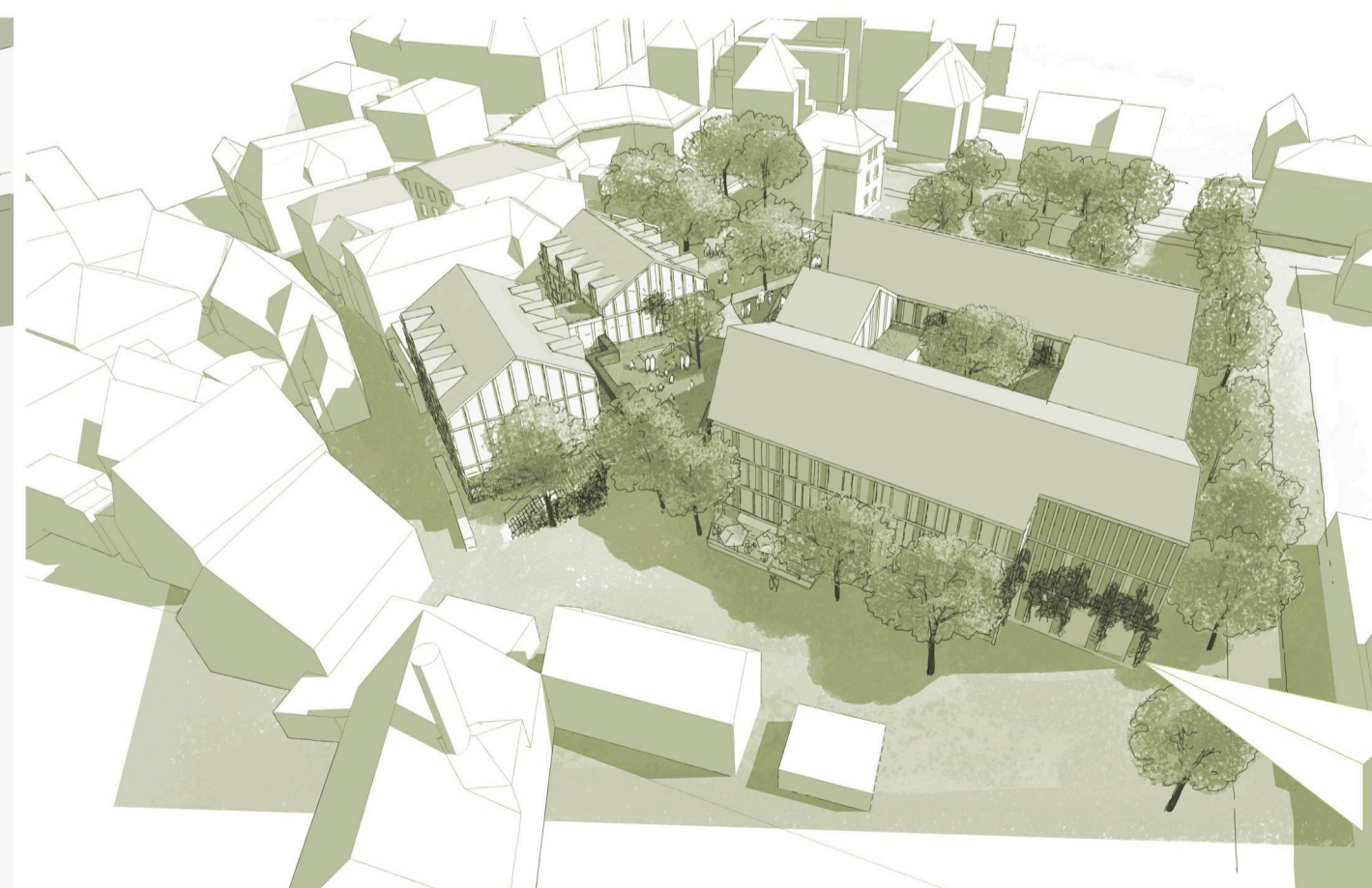
skizze "vogelschau von nordwest"