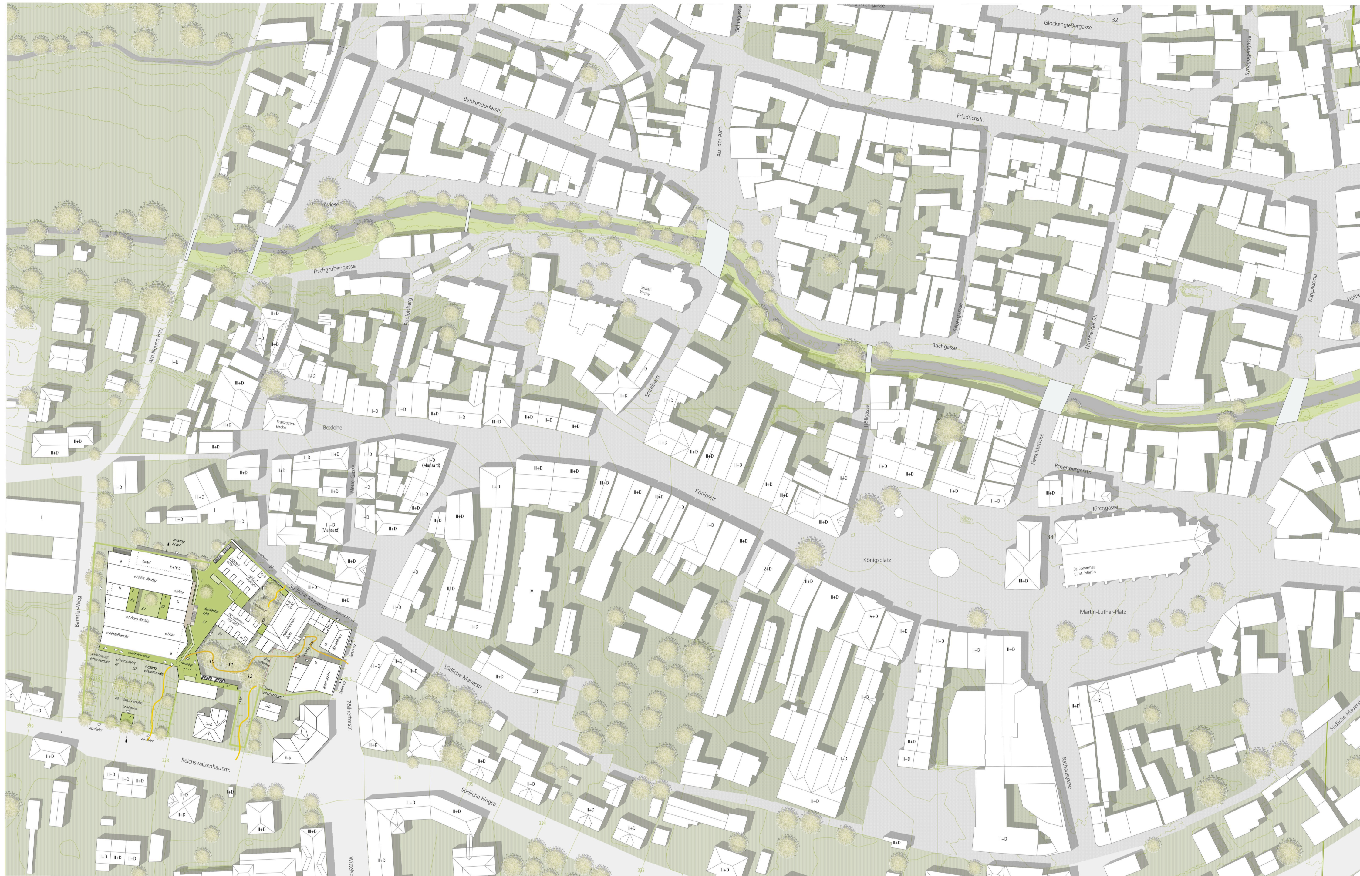
lageplan altstadt 1:1000