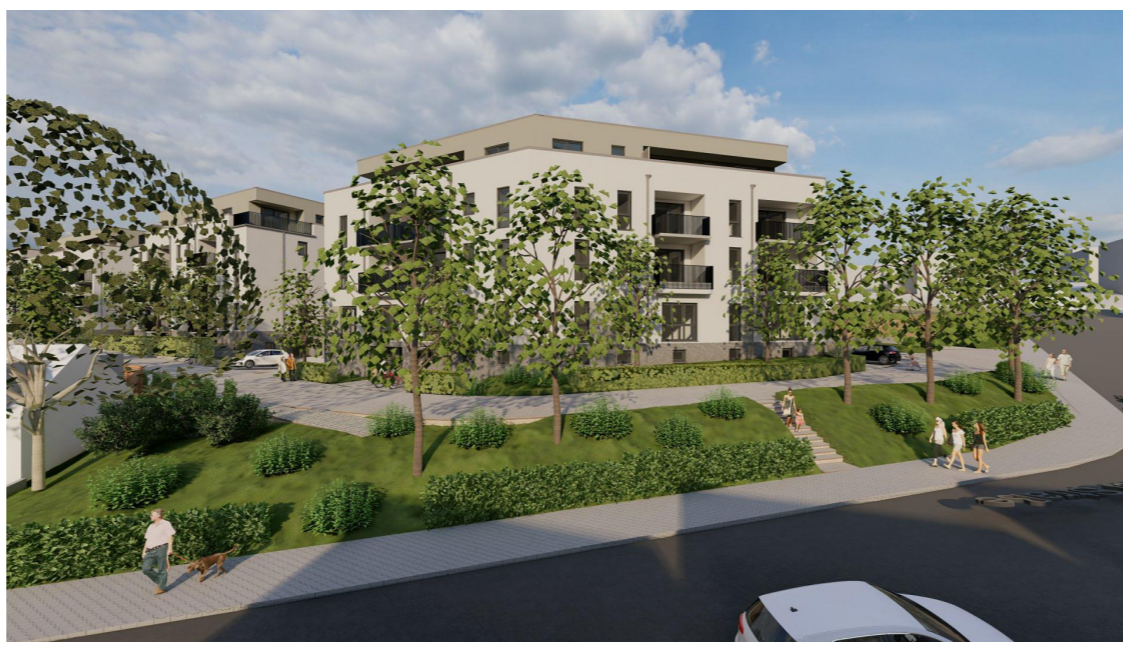
Blick auf den BA5 von der Limbacher Straße