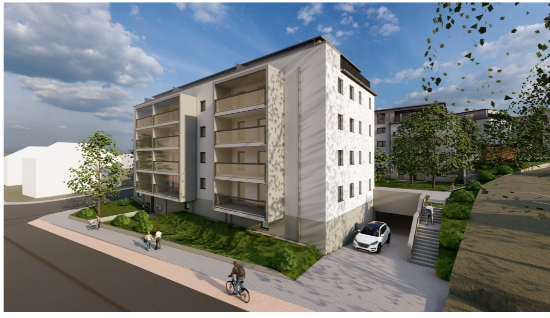
Blick auf den BA4 von der Limbacher Straße