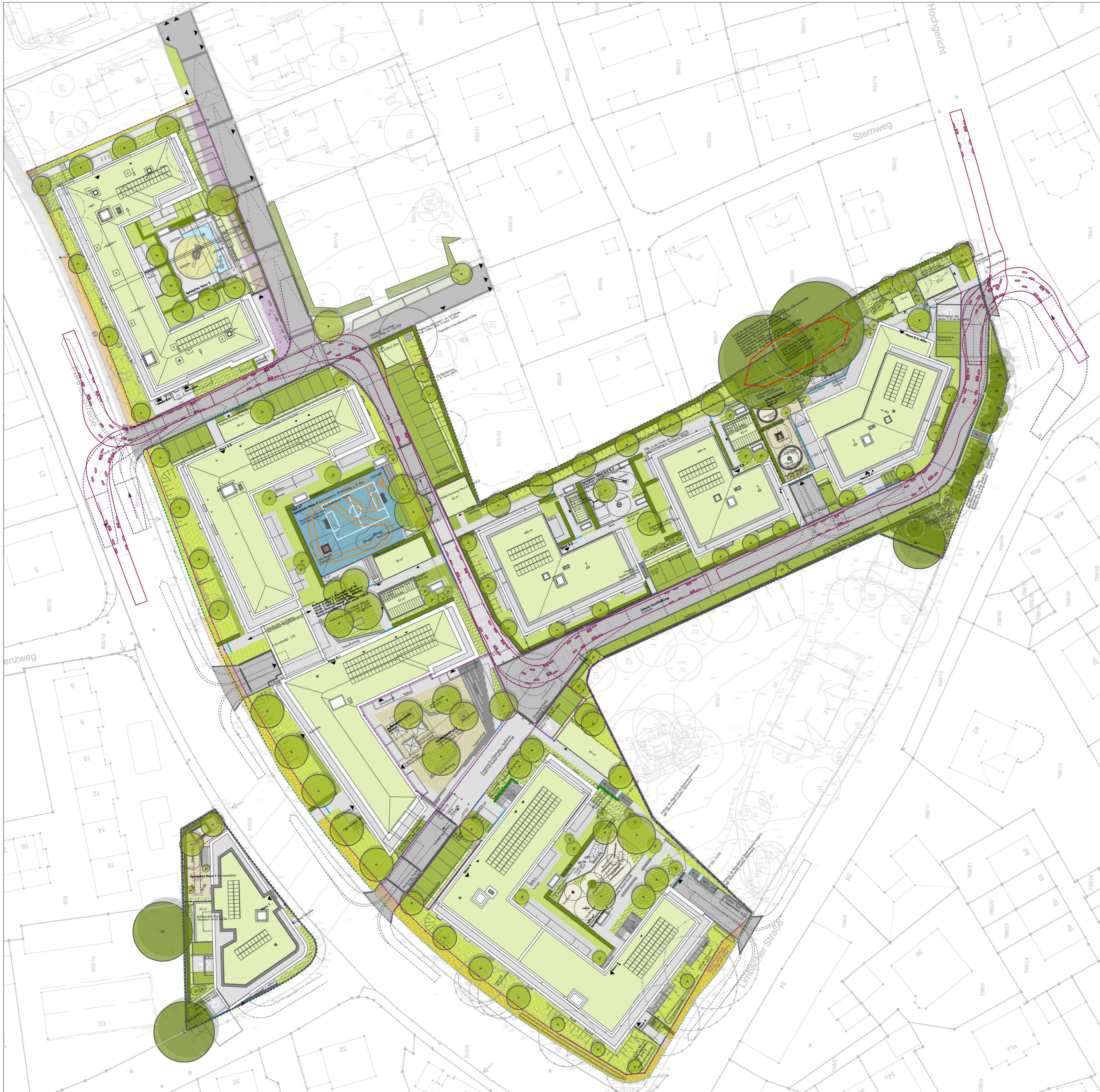
Freiflächenplan inklusive Fahrspur der Feuerwehr (lila) und von Pkw (grau)