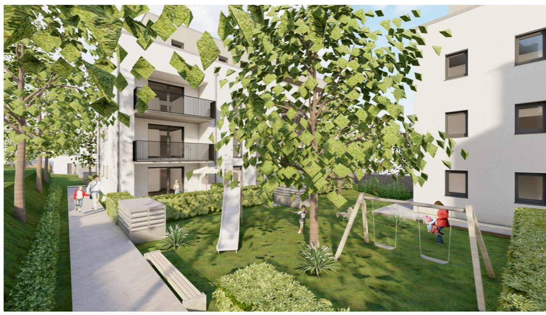
Freianlagen des BA5 entlang der nördl. Grundstücksgrenze