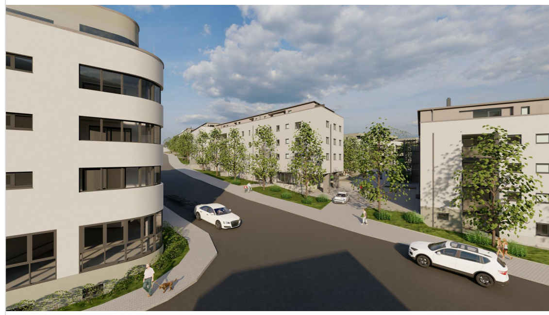
Blick in die Fürther Straße aus Süden