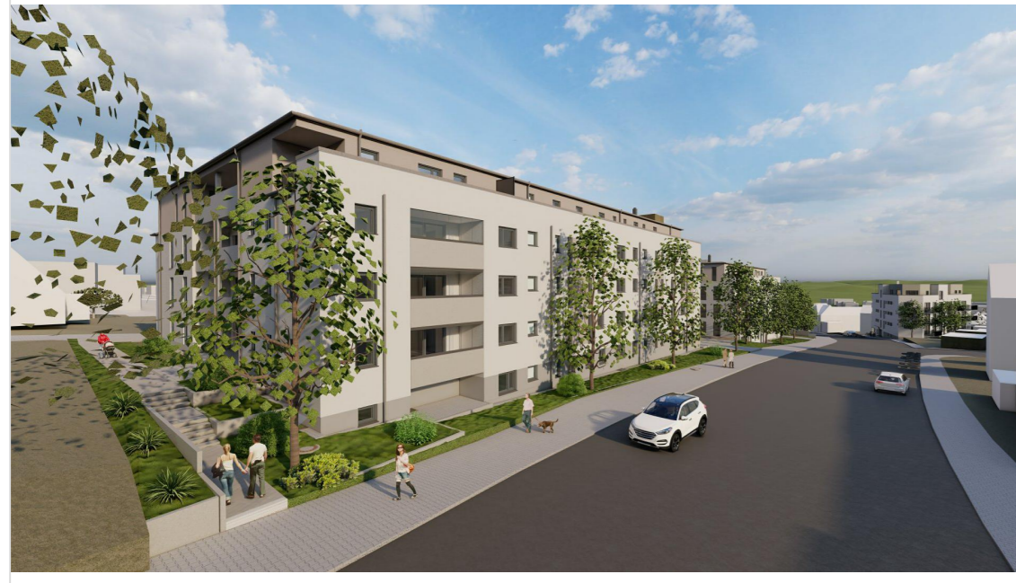
Blick in die Fürther Straße aus Norden