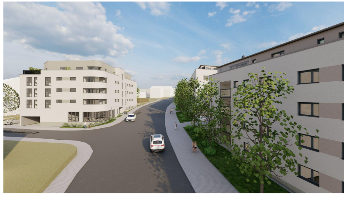
Blick in die Fürther Straße aus Süden