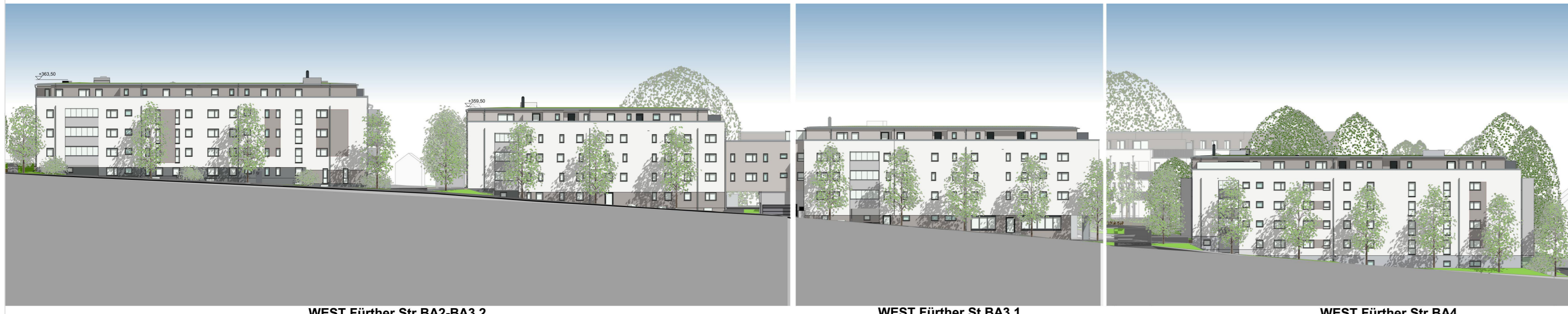
Ansichten Bauabschnitt 2-4 (BA 2-4)