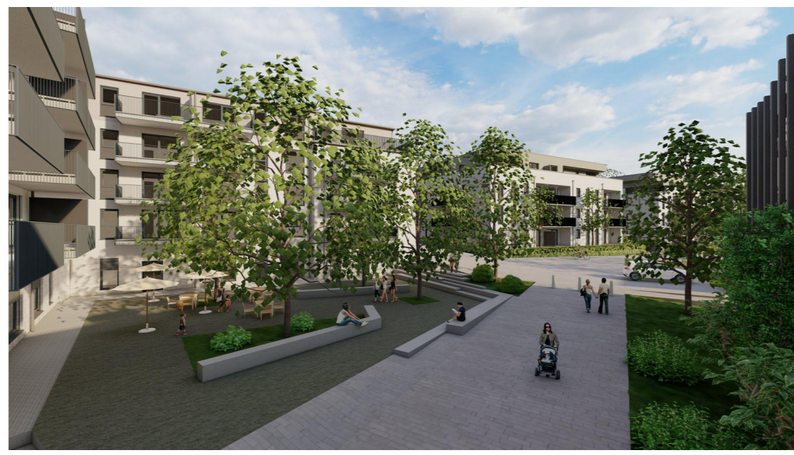
Quartiersplatz zwischen BA3 und BA4