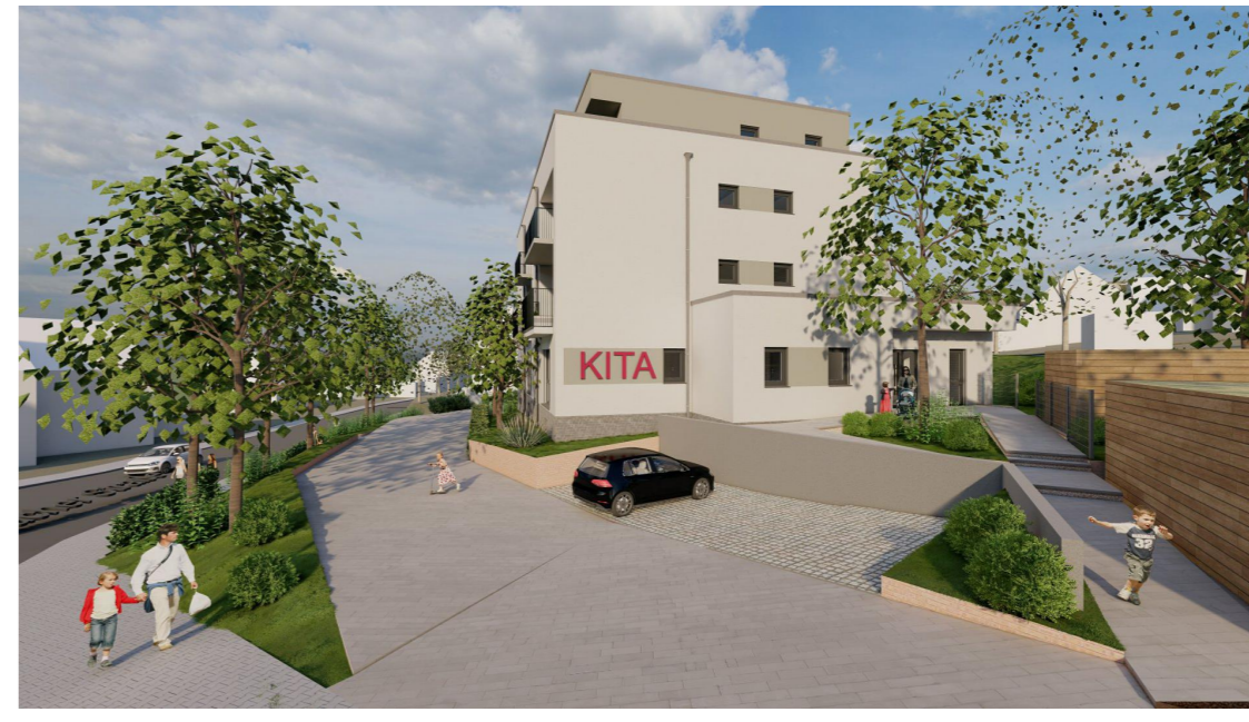
Blick auf Kita im BA5 vom Hochgericht