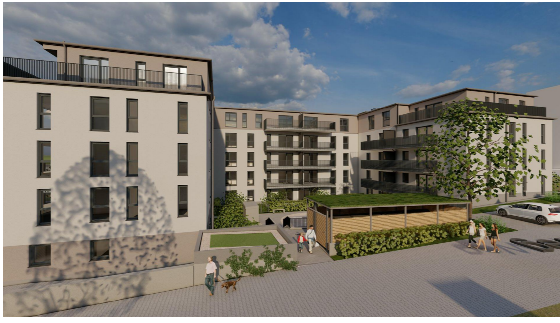
Blick auf den Innenhof des BA2 vom Nasbacher Weg