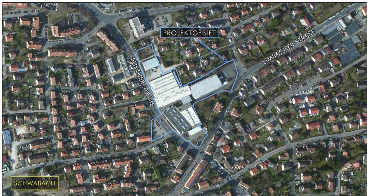
Abb. 1: Lage des Projektgebietes (hellblau markiert) mit hinterlegtem aktuellem Luftbild.

Gegenstand der Luftbild- und Aktenauswertung ist ein etwa 17.500 m 2 großes Areal an der Fürther Straße im Nordosten Schwabachs, vgl. Abb. 1: