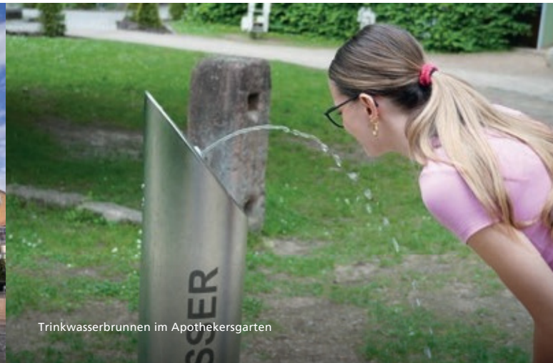
Trinkwasserbrunnen im Apothekergarten