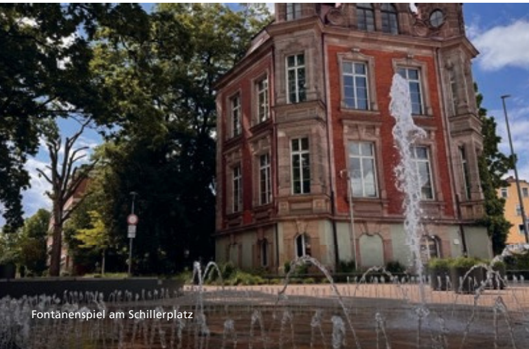
Fontänenspiel am Schillerplatz