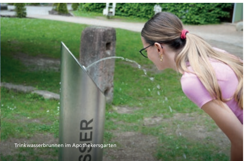
Trinkwasserbrunnen im Apothekergarten