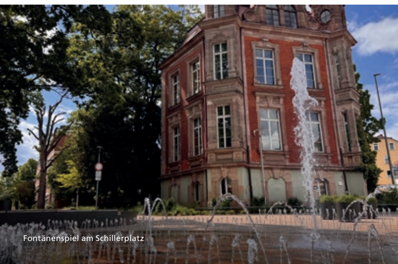
Fontänenspiel am Schillerplatz

Helfen Sie mit, damit die Schwabacher Bevölkerung und unsere Gäste besser durch heiße Tage kommen! Alle Infos dieses Flyers sowie Weiteres finden Sie unter www.schwabach.de/hitzetipps