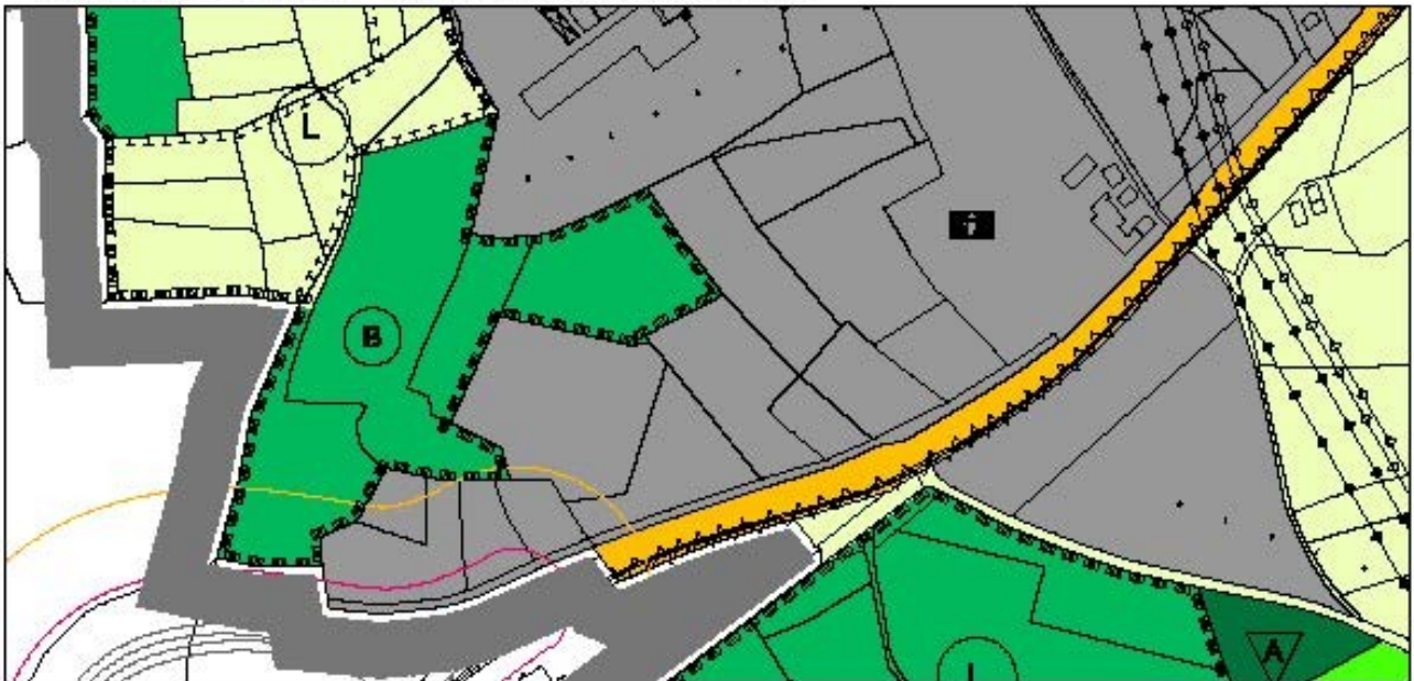
5. Teiländerung des FNP

Auszug aus dem gültigen FNP vom 02.09.2011, zuletzt geändert durch 6. Teiländerung vom 18.11.2022, sowie Berichtigungen (1 - 10) gem. § 13a Abs. 2 Nr.2 BauGB