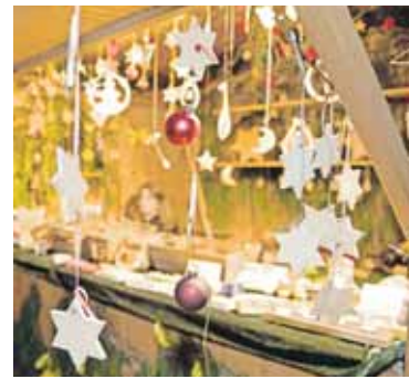
Zum zweiten Mal öffnet der Weihnachtsmarkt vom 12. bis 15. Dezember.

D as erste Weihnachtsmarkt-wochenende in Schwabach findet vom 6. bis 8. Dezember statt. Die liebevoll gestalteten Buden auf dem Königsplatz sind von 11 bis 20 Uhr geöffnet. Neben viel selbstgemachtem Handwerk finden sich natürlich auch zahlreiche Gaumenfreuden. Das beliebte Lichterschiffchenfahren startet am Sonntag, 8. Dezember, um 17 Uhr an der Wöhrwiese. Organisiert wird der Markt vom Verkehrsverein.