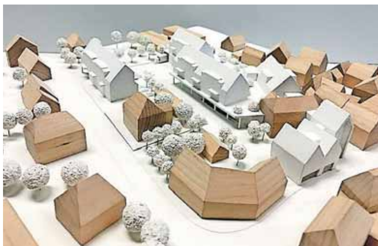
Ein Modell der Planungen: Neu geplante Gebäude sind weiß. Links verläuft die Reichswaisenhausstraße, rechts die Zöllnertorstraße. Das große Gebäude vorne ist die ehemalige Gaststätte.

„Wichtig ist festzuhalten, dass sich die konkreten Planungen im Laufe des Verfahrens, insbesondere nach den noch zu erstellenden Lärm- und Verkehrsgutachten und der Bürgerbeteiligung noch ändern können“, erläutert Stadtbaurat Ricus Kerckhoff. Der Vorhabenträger Ten-Brin-