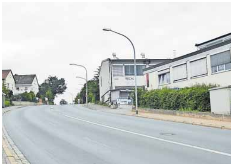
An der Fürther Straße soll ein Wohnquartier errichtet werden.

Erste Konzepte der Planungsbüros werden am Dienstag, 3. Dezember, im Bürgerhaus, Königsplatz 29a, öffentlich vorgestellt und diskutiert. Interessier-