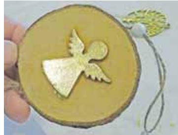
Ein weihnachtlich vergoldetes Motiv

Der Kurs beginnt um 10:30 Uhr und dauert etwa 90 Minuten. Die Gebühr beträgt 35 Euro