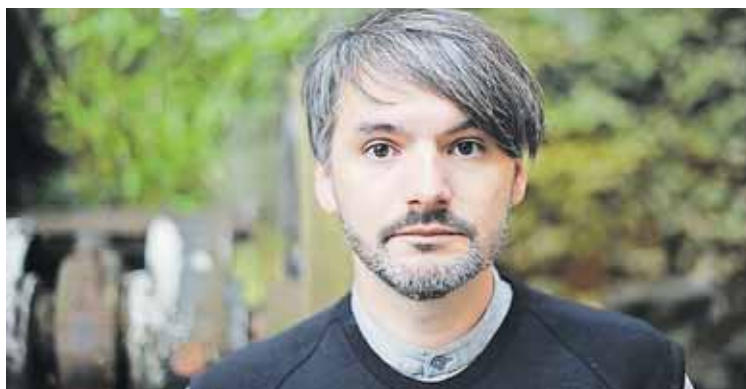
Der Erfolgs-Autor Saša Stanišić

Die Lesung von Saša Stanišić bei der diesjährigen Schwabacher LesArt wird aus Platzgründen in den Markgrafensaal, Ludwigstraße 16, verlegt. Der aus dem ehemaligen Jugoslawien stammende Autor hat für sein aktuelles Buch „Herkunft“ den Deutschen Buchpreis 2019 erhalten. Entsprechend groß ist die Nachfrage nach Karten für seine Lesung in Schwabach. Der Termin für die Lesung am Donnerstag, 7. November, 20 Uhr, bleibt gleich.