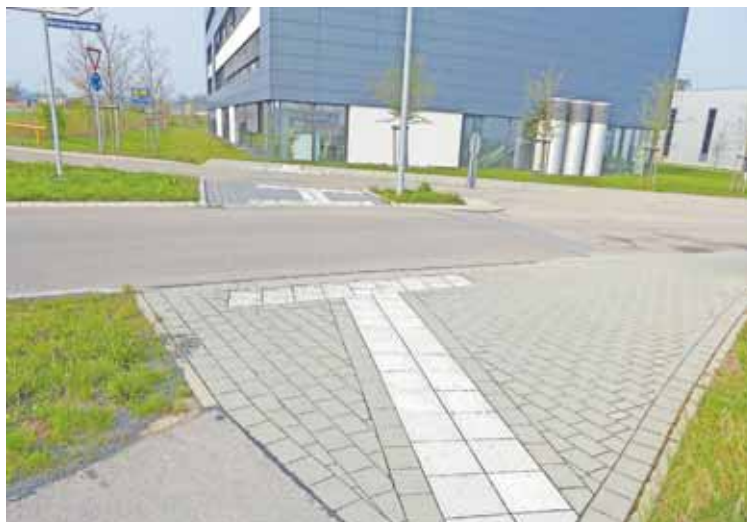
So wie hier an der Goldschlägerstraße im Gewerbepark West sollen weitere Fußgängerüberwege in Schwabach barrierefrei ausgebaut werden.

Faktoren wie zum Beispiel Verkehrsaufkommen und Gefährdungspotential führten zu einer Prioritätenliste, an der sich der barrierefreie Ausbau orientiert. Bei dem Ausbau der Querungsanlagen kann es im Einzelfall erforderlich sein, dass von der Prioritätenliste abgewichen wird. So können Gründe wie zum Beispiel der besondere Bedarf Betroffener oder