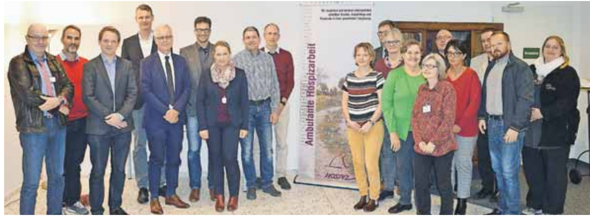
Mitglieder des Palliativ- und Hospiz-Netzwerkes trafen sich mit den Zuständigen der Stadt.

Übergeordnetes Ziel aller Beteiligten ist es, todkranke Menschen und deren Familien lückenlos zu begleiten. Dabei treten häufig ganz konkrete Probleme auf: Wo bekommt man schmerzlindernde Medikamente, wenn man am Freitagnachmittag aus dem Krankenhaus nach Hause entlassen wird? Wer kann am Wochenende entsprechende Rezepte ausstellen? Und wie kann man Apotheken und Ärzteschaft besser in den Pflegeverlauf einbeziehen? Welche Lehren können Angestellte in der Behindertenhilfe von der