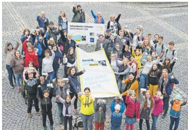
Gemeinsam stark für Faire Produkte: Die beteiligten Schülerinnen und Schüler und ihre Lehrkräfte zeigen stolz die Schokoladentafeln mit den individuellen Motiven des Malwettbewerbs.

Diese Schokolade können alle mit gutem Gewissen naschen, denn sie ist unter fairen Bedingungen hergestellt worden. In der Fairtrade-Steuerungsgruppe der Stadt wurde außerdem mit der Hans-Peter-Ruf-Schule, der Hermann-Stamm-Realschule, dem Wolfram-von-Eschenbach-Gymnasium, der Christian-Maar-Schule und dem Adam-Kraft-Gymnasium ein Malwettbewerb ausgerufen. Die Gewinnermotive sind jetzt auf den Etiketten von Vollmilch- und Zartbitter-Schokoladen zu sehen. Die Tafeln werden bereits mit großem Erfolg in den Schulen verkauft. ■