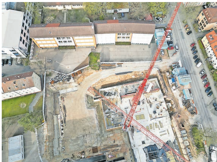
Weil der Erweiterungsbau an der Helmschule erst 2025 fertig ist, finden dort derzeit zusätzliche Klassen keinen Platz.

Parallel wird die Johannes-Helm-Grundschule nach den Ergebnissen der Schuleinschreibung im Schuljahr 2023/2024 auf 20 Klassen wachsen, die im Schulhaus nicht komplett