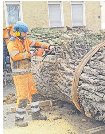
Diese riesige Pappel wird ein Zuhause für Insekten.

Eine ganz besondere Aktion des Projektes erfolgte bereits Ende Februar. Damals musste die Stadt die riesige Pappel neben der Wirtschaftsschule in der Hin-