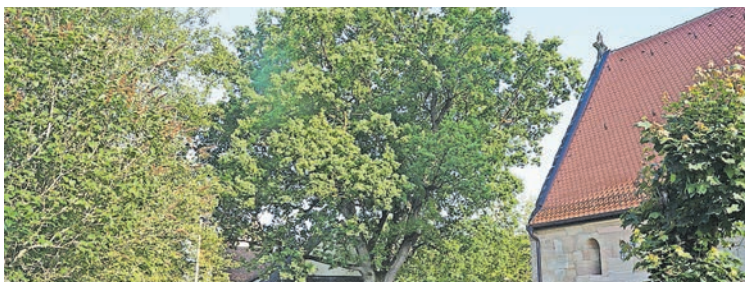
Bäume in der Stadt tragen in heißen Zeiten zur Abkühlung bei.

Man kann sich mit einem abgeschlossenen Projekt oder einer geplanten Aktion für den Umwelt- und Naturschutzpreis 2023 bewerben. Für die 17. Auflage des Umwelt- und Naturschutzpreises steht ein Preisgeld von insgesamt 4.000 Euro zur Verfügung. Neben der