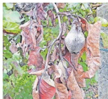
Befallener Quittenzweig mit Fruchtmumie. Nicht immer ist der Befall so deutlich.