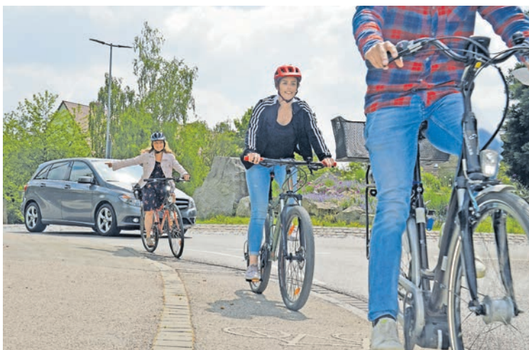
Alle Radbegeisterten können beim STADTRADELN ein Zeichen setzen.

Im diesjährigen Aktionszeitraum vom 18. Juni bis 8. Juli sollen wieder möglichst viele Alltagsstrecken mit dem Fahrrad zurückgelegt werden. Egal ob es sich um den täglichen Weg zur Arbeit, zum Einkaufen oder um einen Familienausflug am Wochenende handelt. Jeder gefahrene Kilometer zählt, um das Ergebnis des letzten Jahres zu steigern und mehr CO 2 ein-