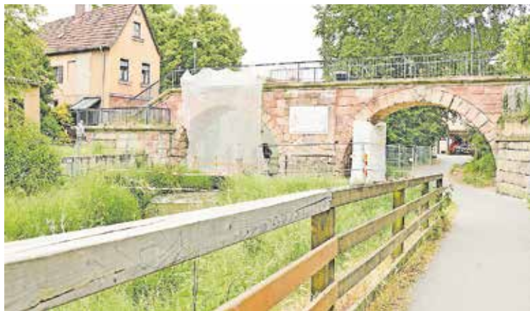
Die Sanierungsarbeiten an der Brücke haben begonnen.

Die Sandsteinbogenbrücke an der Schwabach wird saniert. Derzeit werden die Fugen der Bögen von zu harten Mörtelteilen und Ziegelergänzungen befreit, anschließend wird mit einer Tiefenverfugung die Standsicherheit erhöht. Danach werden die Sandsteine entsalzt und oberflächlich verfestigt