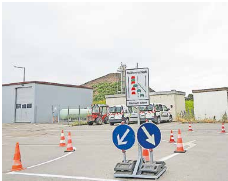
Ab sofort führen zwei Fahrspuren in den Recyclinghof. Die Stadtdienste weisen darauf hin, das Reißverschlussprinzip anzuwenden.

Wichtig ist auch: Es gibt nach dem STOP-Schild zwei Zufahrtsspuren. „Nutzen Sie bitte beide Spuren und wenden Sie das ausgeschilderte Reißverschlussverfahren an. Bei Rot an der Ampel stehen bleiben, sollte selbstverständlich sein, auch wenn der Recyclinghof vermeintlich leer aussieht. Wir