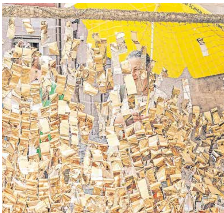
Das Motto „Im Zeichen des Goldes“ steht bei ortung im Vordergrund.

Bei ortung-family können die Kunstwerke von Familien mit Kindern ab sechs Jahren spielerisch und mit allen Sinnen