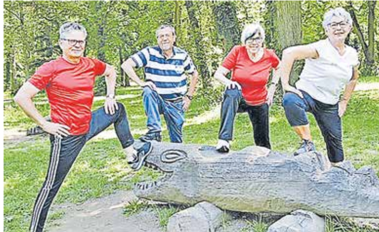
An frischer Luft und in der Gruppe machen die Fitness-Übungen doppelt Spaß. Kraft, Koordination und Ausdauer werden so gestärkt.

Durch gezielte Übungen sollen Geist und die Gelenke beweglich gehalten werden. Durch ein abwechslungsreiches Training werden Ausdauer, Kraft und Koordination sowie die allge-