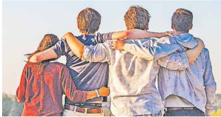
Bereitschaftspflege-Eltern unterstützen Kinder oder Jugendliche

P flegeeltern, die Kinder in Akutsituationen für einen begrenzten Zeitraum bei sich aufnehmen, sucht der Pflegekinderdienst des Amtes für Jugend und Familie. Denn seit Jahren steigt die Zahl der Kinder, die zeitweilig aus ihren Familien herausgenommen werden. Die Gründe hierfür sind vielfältig: Vernachlässigung der Kinder, Überforderung, Krankheit sowie eine akute Lebenskrise der Eltern sind mögliche Gründe. In diesen Notsituationen muss schnell gehandelt werden. Es kommt mitunter zu einer sehr kurzfristigen und ungeplanten Trennung der betroffenen Kinder von der Herkunftsfamilie, um eine Gefährdung der Kinder abzuwenden. Das Amt für Jugend und Familie ist dann auf flexible und geeignete Bereitschaftspflegeeltern angewiesen. Die Kinder werden dann