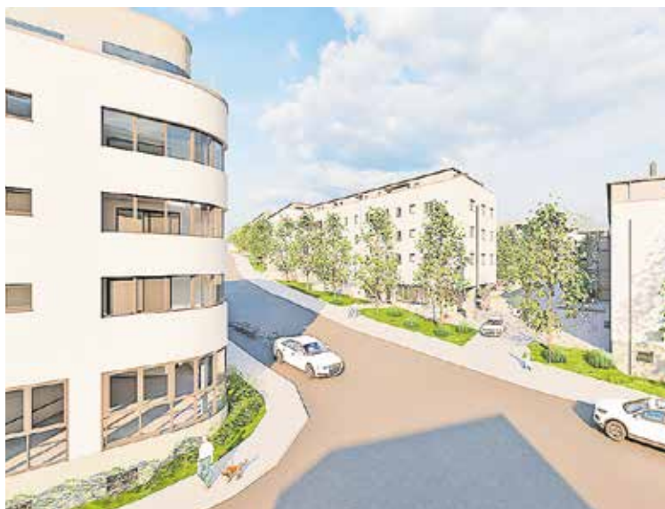
Eine Mischnutzung von Wohnen, Gewerbe und Kindergarten ist im neuen Quartier vorgesehen, hier ein Modell.

Der Quartiersplatz stellt die räumliche und funktionale Mitte dar. Er ist das Gelenk des Fuß- und Radwegekreuzes und wird durch Bäcker und Quar-