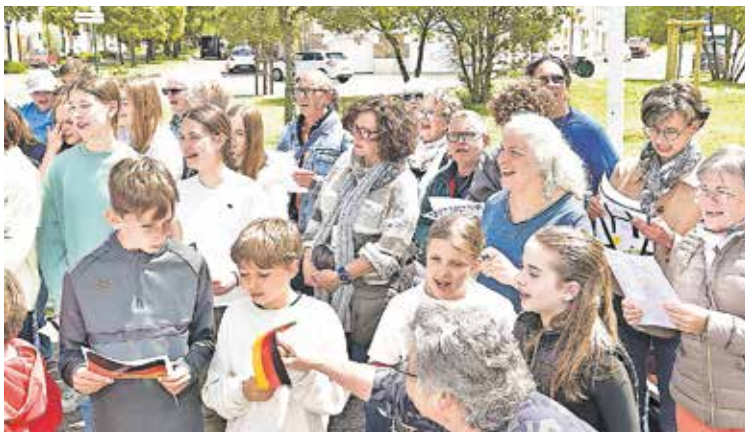
Ein Musikalisches Hoch auf die deutsch-französische Freundschaft

Ein weiterer Höhepunkt war Ende Juni in Frankreich die Enthüllung der Bronzeskulptur „Schwabacher Herz“ auf dem Place Schwabach. Dieses Werk stammt aus dem Atelier des Künstlers Clemens Heindl und wurde von ihm letztes Jahr zusammen mit Burkhard Moser in einer beeindruckenden Schnitz- und Gussaktion in