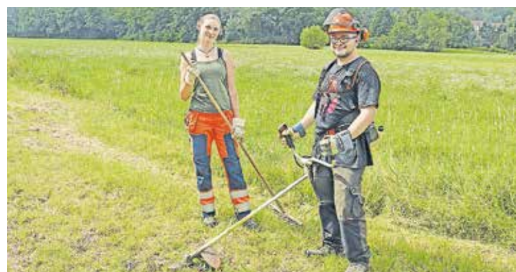
Die Bufdis im Umweltschutzamt arbeiten viel draußen.

Die Hauptaufgabe der Bufdis sind Pflegemaßnahmen in Biotopen. Sie mähen Wiesen, pflegen Hecken oder pflanzen Obstbäume und Sträucher.