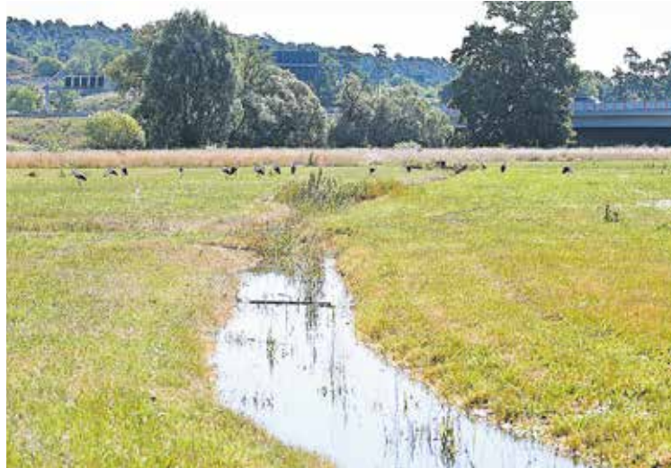
Die Wässerwiesen im Rednitztal bieten Abkühlung – und Nahrung.

W egen der Klimaerwärmung gewinnen die traditionellen Wässerwiesen im Rednitztal an Bedeutung. Die Städte Nürnberg und Schwabach wollen sich deshalb gemeinsam für deren Erhalt einsetzen. Der bayerische Naturschutzfonds fördert das zunächst für drei Jahre bewilligte Projekt mit 120.000 Euro. Ab Juli soll nun in einem ersten Schritt der Zustand der technischen Anlagen überprüft werden. Außerdem sollen die Biotop entlang der Wässerwiesen mit Blick auf Artenschutzmaßnahmen und Renaturierung untersucht werden.