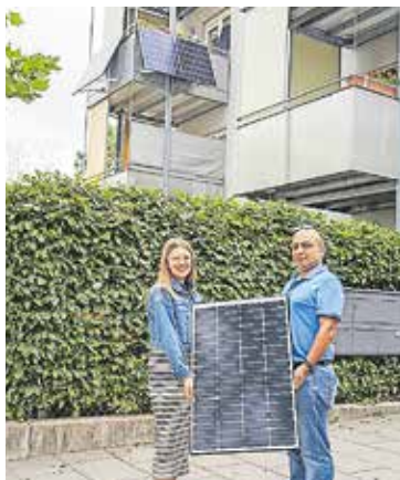
Test erfolgreich: Balkon-PV-Anlagen können für Mieter der GEWOBAU bezuschusst werden.

Stecker-PV-Anlage mit Zuschuss: Nach einer erfolgreichen Testphase bietet die GEWOBAU ihren Mieterinnen und Mietern ab sofort die Möglichkeit, sogenannte steckerfertige Photovoltaik-Anlagen (auch Balkonkraftwerke oder Stecker-PV genannt) auf dem Balkon oder im Mietergarten an der Wohnung als eigenen Beitrag zur Energiewende installieren zu lassen.