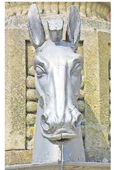
Pferdekopf am Brunnen