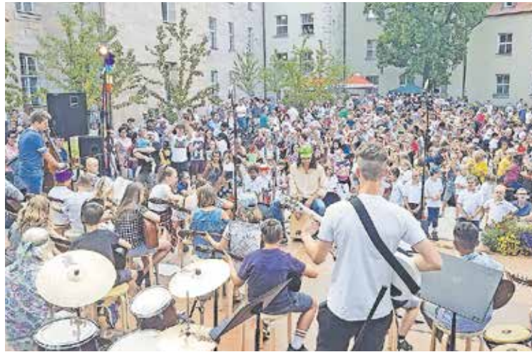
Impression eines Open Air-Konzerts im Innenhof des Alten DG

Am Donnerstag, 6. Juli, um 18 Uhr wird die Bühne freigegeben für die Streicher. Es treten beispielsweise die Schwabacher Goldstreicher unter Leitung von Birka Falter, die Streicherklassen der Luitpoldschule und die