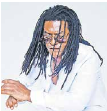
Mayito Rivera & Sons of Cuba

Ritmos Latinos feiert vom 23. bis 25. Juni sein zehnjähriges Jubiläum. Und dazu bittet das Schwabacher Latin Festival im atmosphärischen Innenhof des Alten Deutschen Gymnasiums aufs Tanzparkett: