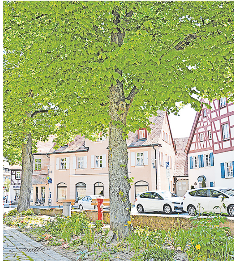
Sitzbänke im Schatten großer Bäume und die neuen Blumenbeete am Martin-Luther-Platz

„Mit den jetzt vorliegenden Plänen wollen wir auch ‚das große Ganze‘ angehen und den Platz zur grünen Lunge der Innenstadt umgestalten“, so Sturm weiter. Im Rahmen eines Arbeitskreises konnten der Stadtrat, die Werbe- und Stadtgemeinschaft sowie die Verwal-