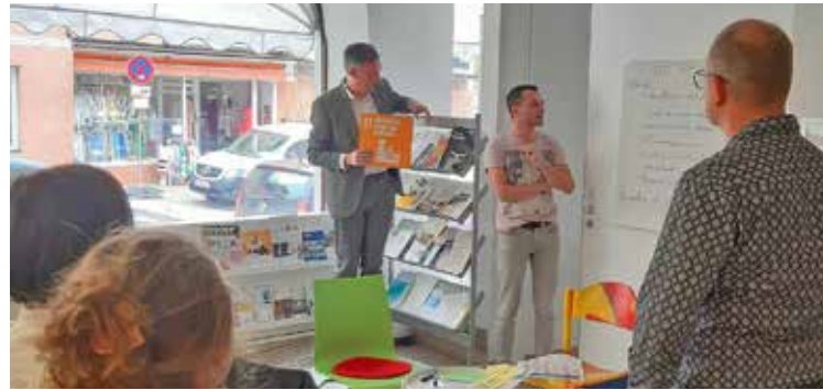
Teilnehmende am verwaltungsinternen Kick-Off zur Nachhaltigkeitsstrategieentwicklung im März 2023.

Im Frühjahr führte das Bürgermeister- und Presseamt der Stadt deshalb zwei verwaltungsinterne Workshops mit Beteiligung der städtischen Tochterunternehmen durch. Dabei wurden die thematischen Schwerpunkte