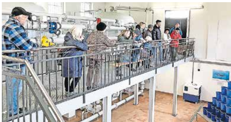
Die Führungen im Wasserwerk stoßen immer auf viel Interesse.

Die Schwabacher Stadtwerke kümmern sich neben der Energie- auch um die Trinkwasserversorgung in der Stadt.