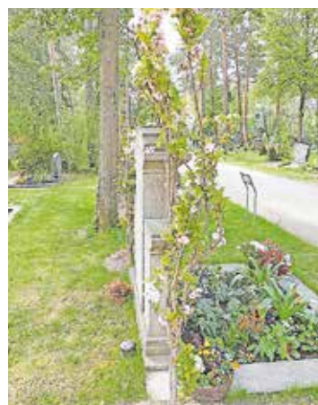
Sträucher und Säulenkirsch (rechts) neben den Gräbern