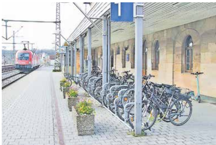
Die neuen Fahrradabstellanlagen am Gleis 1

Insgesamt 100 neue Fahrradstellplätze hat das Tiefbauamt am Bahnhof Schwabach seit 2020 geschaffen. Zusätzlich zu den bereits gut eingeführten Doppelstock-Anlagen konnten im März noch einmal zwanzig weitere Fahrradstellplätze in Betrieb genommen werden. Der letzte Teilabschnitt dieses Projektes im Rahmen der Bike+Ride-Offensive der Deutschen Bahn besteht aus drei Reihenbügelanlagen, die unter dem Vordach des Bahnhofsgebäudes wettergeschütztes Fahrradparken ermöglichen. Die neu montierten Fahrradbügel wurden