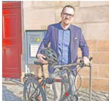
OB Reiß vor dem Rathaus

Wer gerne ein Anliegen oder eine Idee besprechen möchte oder Fragen zu bestimmten kommunalen Themen hat, kann ganz spontan auf sie zugehen. Die Drei werden an einem Stehtisch nahe der Rathaus-Arkaden