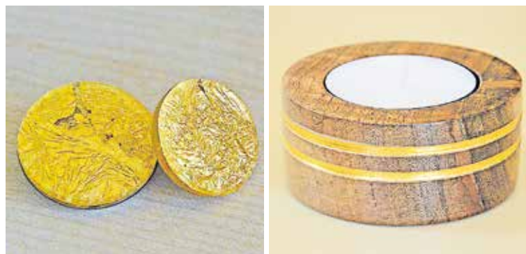
Broschen und Teelichthalter

Das Bürgerbüro verkauft ab sofort zwei neue Blattgoldartikel: Broschen und Teelichthalter. Die Teelichthalter aus Nussbaumholz mit Blattgold-Verzierung gibt es für 14 Euro. Im Preis enthalten ist ein Teelicht mit einem Durchmesser von 5,5 cm.