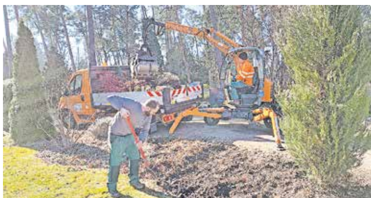
Die Beschäftigten des Friedhofs strengen sich mächtig an.

Die Hecken im Bereich des „Fluss der Zeit“ waren nicht mehr vital, wurden ebenfalls entfernt und durch Früchte tragende Sträucher ersetzt, etwa Holunder-, Kornelkirschen-, oder Riesensalbeisträucher.