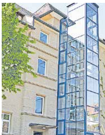
Der Aufzug an der Gebäude-Rückseite

Die Stadt investiert in Maßnahmen zur Verbesserung der Barrierefreiheit und den Brandschutz im Verwaltungsgebäude in der Albrecht-Achilles-Straße. Darin untergebracht sind das Baureferat und das Referat für Umwelt, Mobilität, Nachhaltigkeit und Klimaschutz sowie das Amt für Gebäudemanagement.